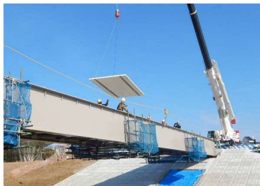
FRP サンドイッチ床版の架設