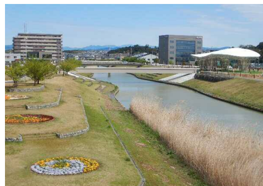
今之浦公園と今之浦公園歩道橋